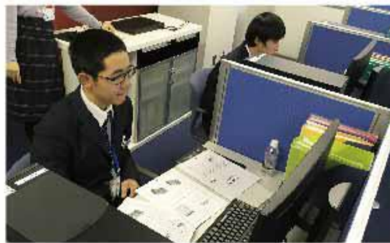
職場体験(株シーアールイー)