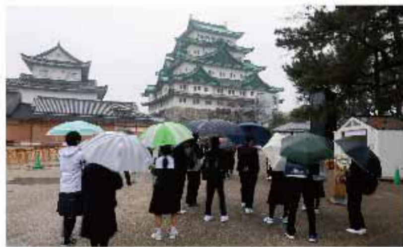
名古屋市生徒による名古屋城内