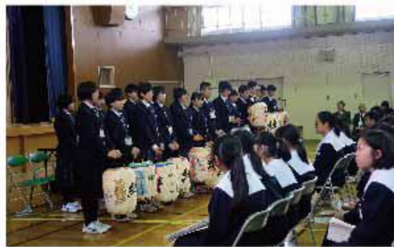
中学生同士の交流