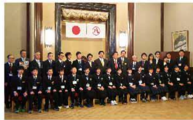
市長・正副議長表敬訪問