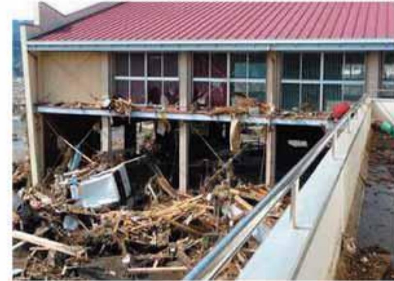
被災した旧小友中学校