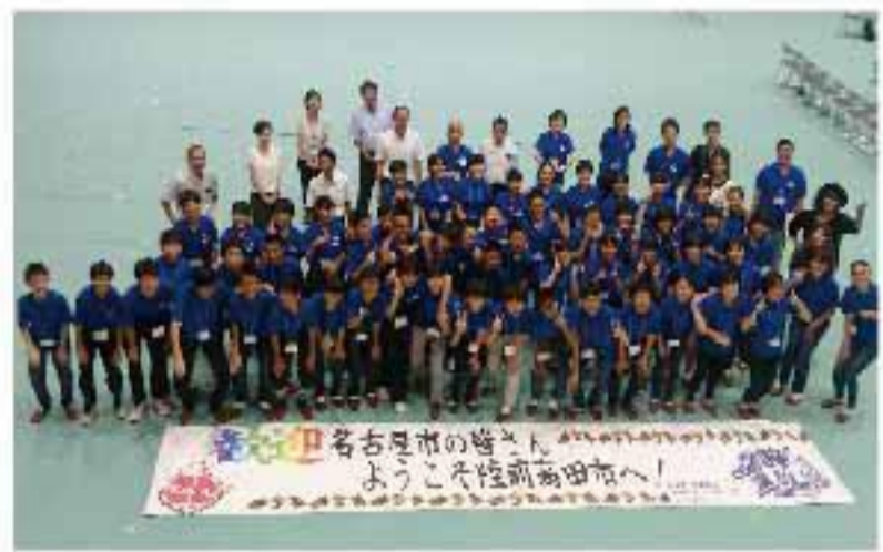
中学生同士の交流