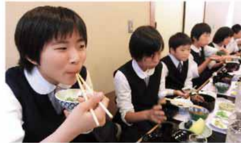
名古屋めし初体験