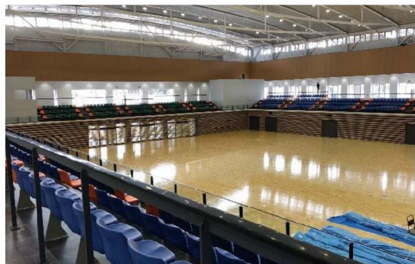
総合交流センター「夢アリーナたかた」