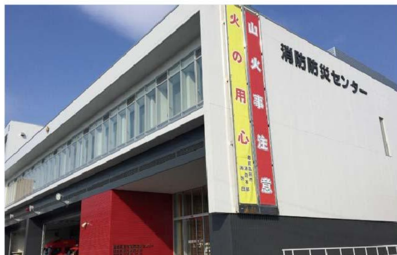
消防防災センター