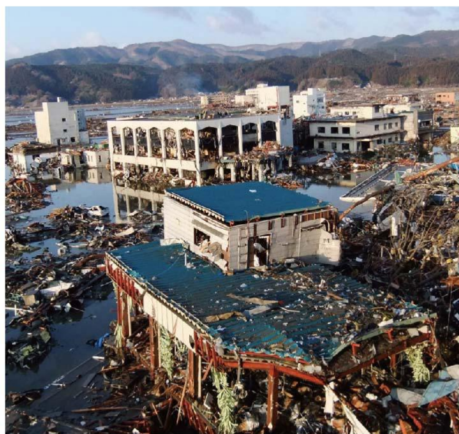
被災直後の市街地