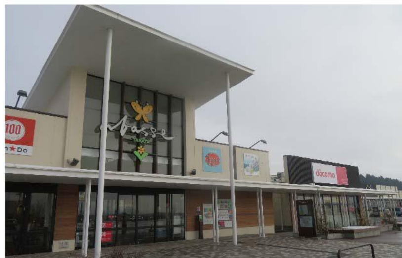
市街地に開業した商業施設