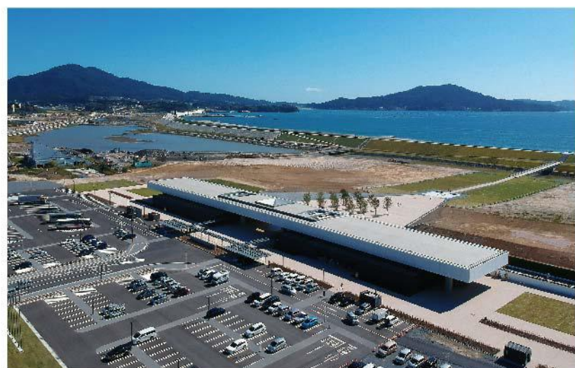
整備が進む高田松原津波復興祈念公園