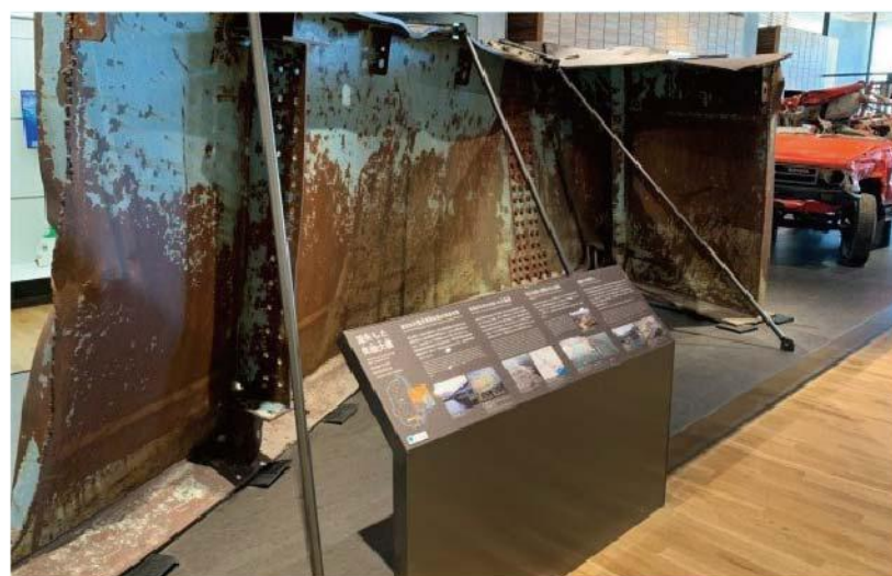
東日本大震災津波伝承館