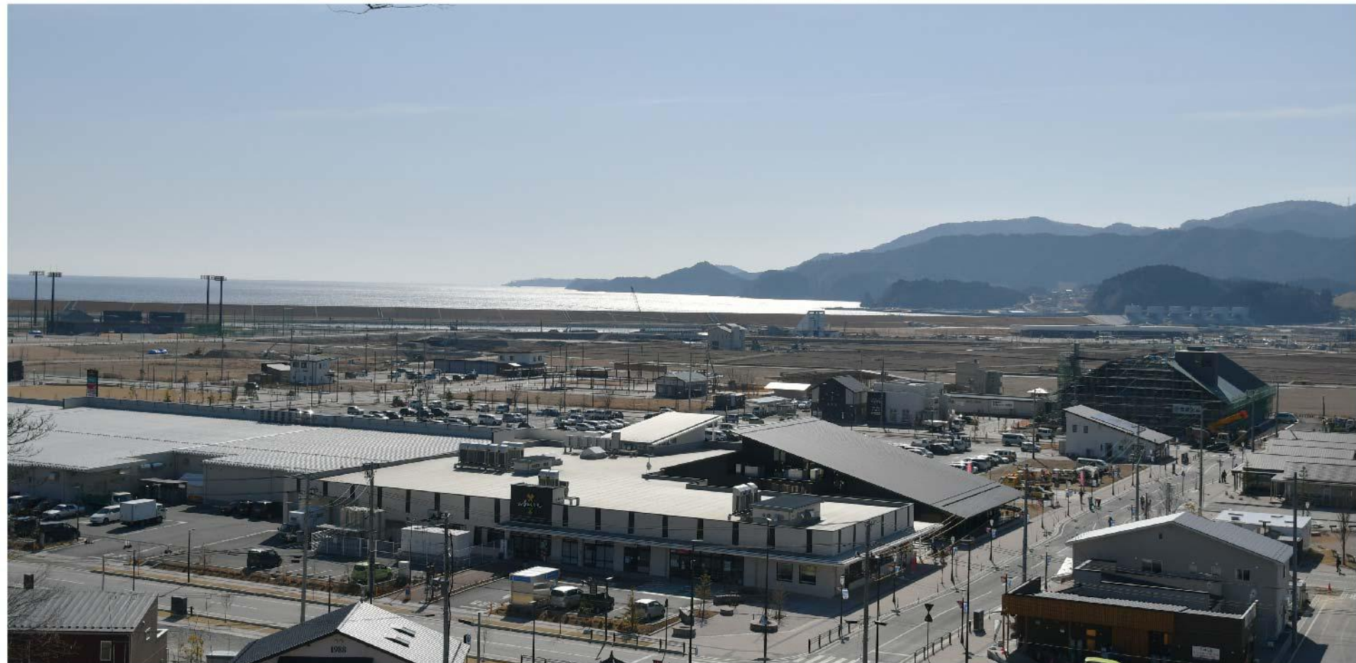
かさ上げし、復興が進む市街地