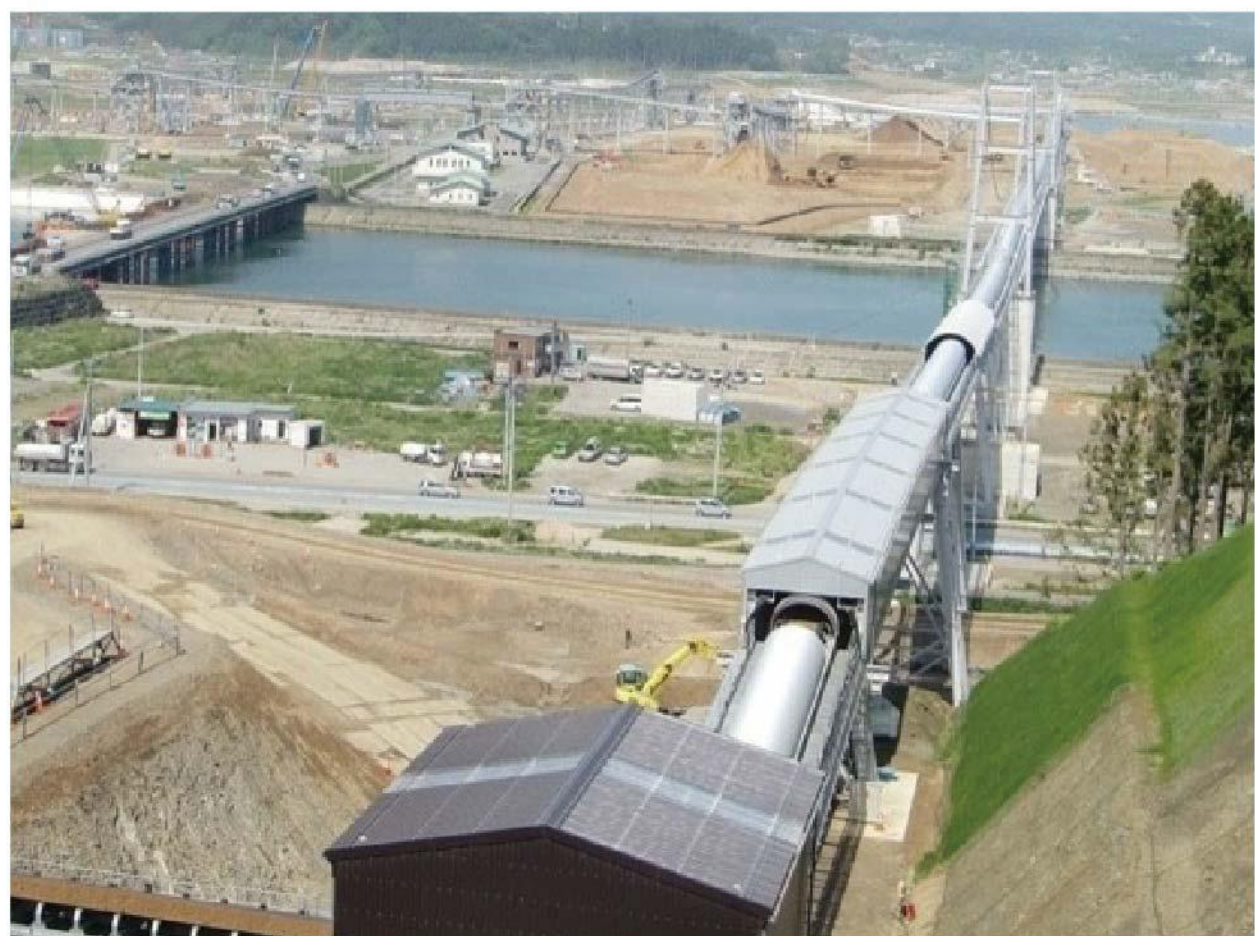
かさ上げ工事を加速させた土砂運搬用の巨大ベルトコンベアー 「希望のかけ橋」