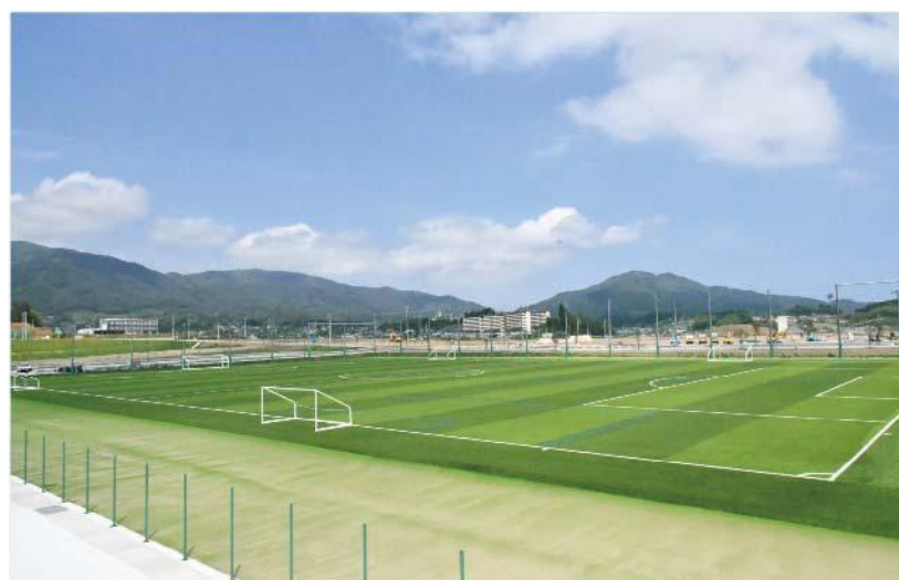
高田松原運動公園